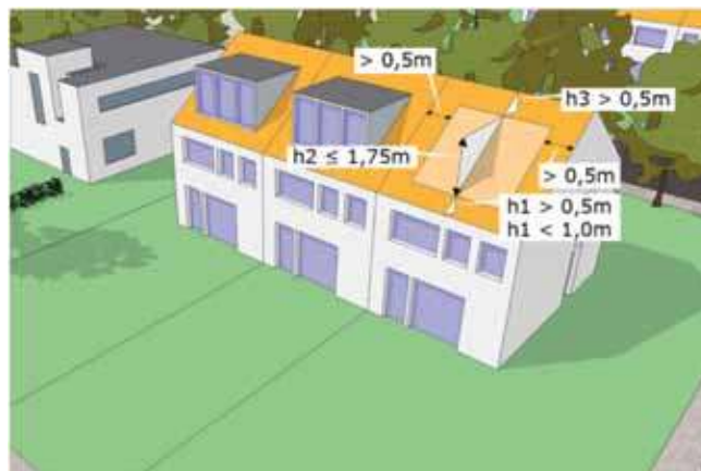
Een dakkapel die voldoet aan de in bovenstaand tekening gegeven afmetingen mag zonder omgevingsvergunning geplaatst worden

Als u een omgevingsvergunning voor het bouwen nodig heeft, legt de gemeente uw bouwplan voor aan de welstandscommissie of stadsbouwmeester. Deze adviseert aan de hand van de welstandsnota over de vorm en het materiaal- en kleurgebruik en of het bouwwerk binnen de directe omgeving past. Om vooraf zoveel mogelijk duidelijkheid te geven over deze beoordeling, moet de